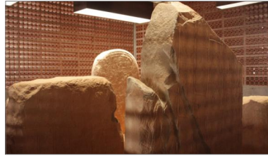
Sala de les esteles